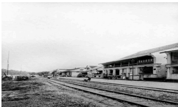
Gambar 1. Jalan Batang Arau, Kota Tua Padang (Sumber : Padang Heritage – KTLV)

Berdasarkan teori yang K. Ansell dan G. Gash (2008) bangun, destinasi wisata akan berhasil jika para aktor yang berperan aktif menjalin sinergi. Aktor-aktor tersebut yaitu pemerintah, masyarakat, dan pihak swasta. Model yang dibuat meyakini bahwa kolaborasi menjadi hal yang perlu ada dalam pengambilan keputusan dan manajemen. Pariwisata budaya pun mempercayai hal yang sama. Jafari (2018) menyatakan pengelolaan destinasi budaya yang sukses harus mempertimbangkan kebijakan yang bersifat kolaboratif. Karena itu, pengelolaan destinasi wisata budaya Kota Tua Padang akan membutuhkan upaya strategis dari kolaborasi pemerintah pusat, pemerintah daerah, dan masyarakat.